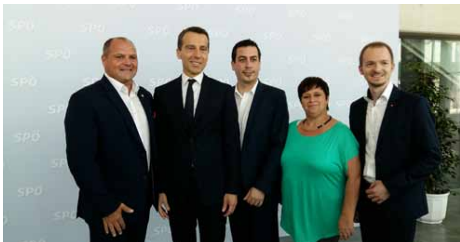
Die Führungsspitze der SPÖ Bezirk Melk mit Bundeskanzler Christian Kern beim Bundesparteitag der SPÖ.

In den kommenden Tagen wünsche ich Ihnen und Ihrer Familie ruhige und besinnliche Weihnachtsfeiertage und für das kommende Jahr 2017 alles Gute, Gesundheit und viel Erfolg.